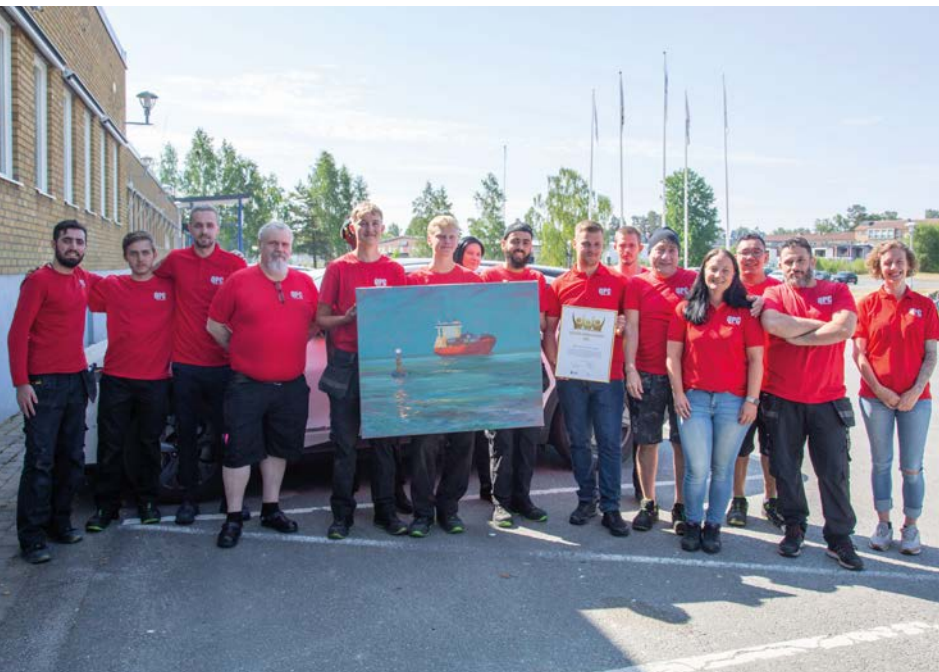
Quality Powder Coating fick Nässjö kommuns och Nässjö Näringslivs mångfaldspris 2023.