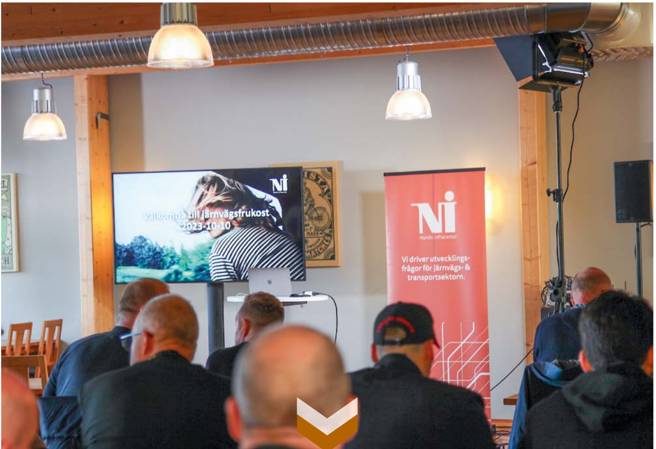
Nordic Infracenters järnvägsfrukostar är mycket uppskattade och lockar deltagare från hela Sverige. Under året arrangerades två järnvägsfrukostar, en i Nässjö och en i samband med Nordic Rail på Elmia.