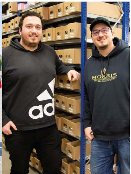
Under året utsågs Narse Group/Teknikhallen (som var Årets unga företagare i Nässjö 2022) till Gasell-företag av Dagens Industri.