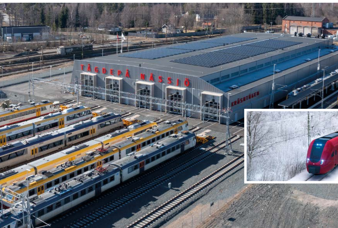
Krösatågens nya tågdepå i Nässjö stod klar under hösten 2023.