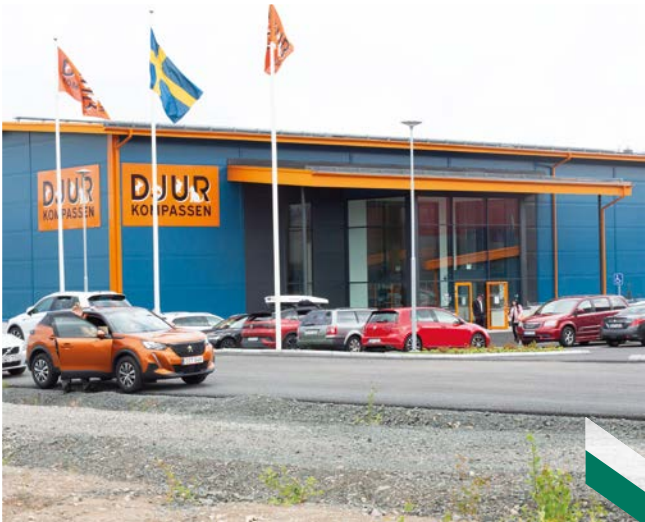
Djurkompassen invigde sin nya butik på Sörängsområdet.