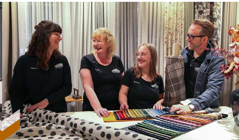
Textilhuset i centrala Nässjö utvecklade verksamheten med en ny, användarvänlig webbshop med möjlighet att måttbeställa gardiner.