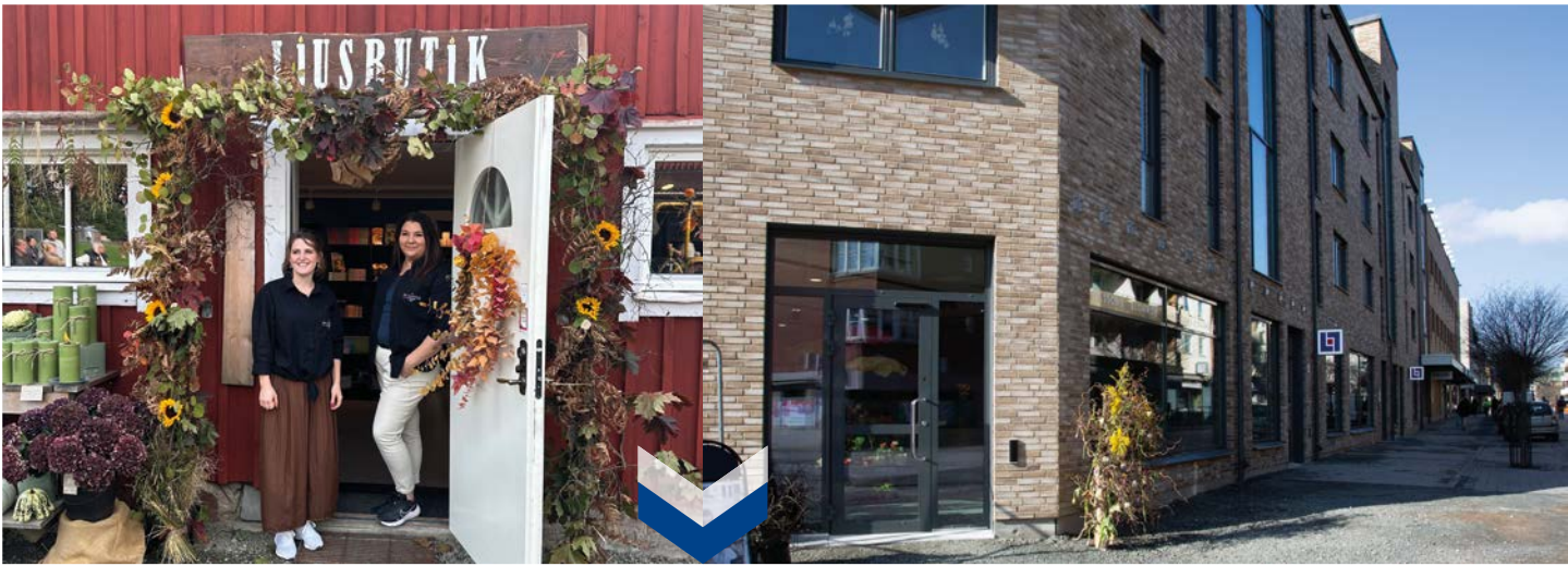
Ljustillverkaren OC Candle öppnade ny ljusbutik på landet utanför Malmbäck.