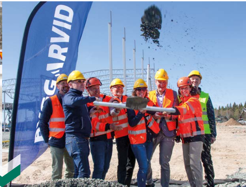
ceos Fritzoe tog första spadtaget till sin nya produktionsanläggning med huvudkontor i Nässjö.