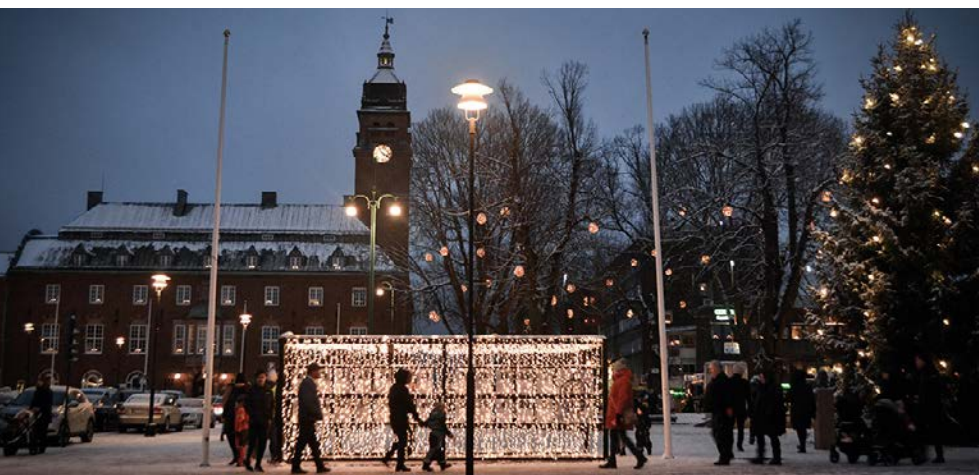
Nässjö Winter Glow är ett nytt koncept för julbelysning som lanserades under 2023.