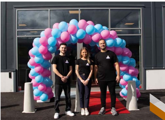
Godisgruvan öppnade sin nya butik på Sörängsområdet med ambitionen att bli en destination för godissugna på hela Höglandet.