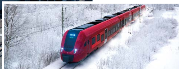
Så här kommer de nya Krösatågen att se ut – de första kommer att testköras från Nässjö under hösten 2024.