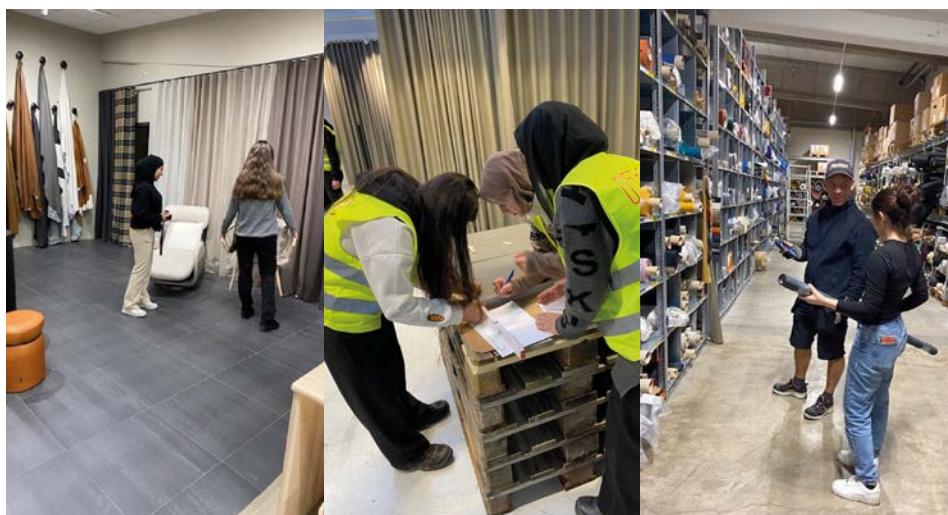
ITAB och Nevotex är två av de företag som medverkar i kompetensförsörjningsprojektet SKAL.